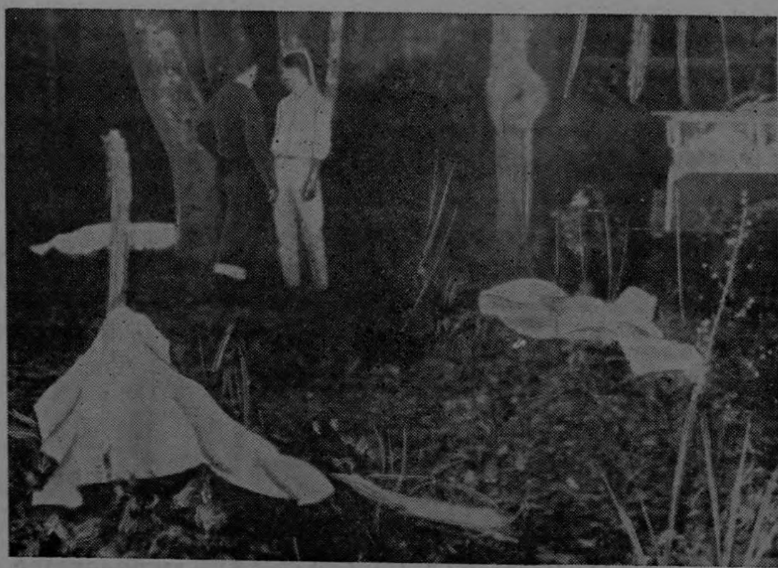
SON QUINCE LAS VICTIMAS. — Tres cuerpos cubiertos con frisas aparecen cerca de los escombros del avión DC-6B de las Naciones Unidas en que viajaba el Secretario General de dicho organismo mundial cuando el aparato se estrelló en las cercanías de Ndola, Rodesia del Norte, causando la muerte de Hammarskjöld y de todos sus acompañantes menos uno que logró salvarse. Brigadas de salvamento han logrado rescatar todos los cadá-