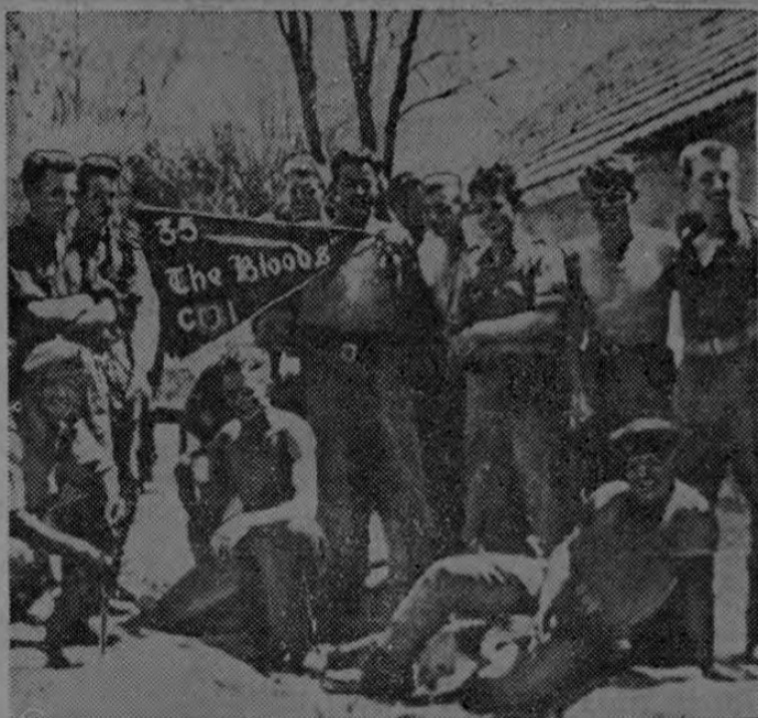
CAEN PRISIONEROS. — Esta fotografía exclusiva, tomada por un fotógrafo de Prensa Unida Internacional que logró burlar la vigilancia de los nativos de Katanga, muestra a un grupo de soldados irlandeses pertenecientes a las fuerzas de las Naciones Unidas, encarecelados en un campo de concentración poco después de haber sido capturados por los soldados de Katanga. Los prisioneros aparecen sonrientes y sujetando la bandera de su unidad militar. Todos ellos, según se informó, están bien de salud y con un alto grado de moral.