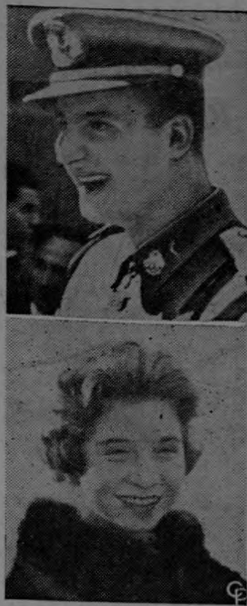
RECIBE A LIDERES NEUTRALES. — El Presidente Kennedy (centro) acompaña por la Casa Blanca al presidente de Indonesia Sukarno y al de Malí, Mobido Keita, quienes llegaron a Estados Unidos en una "misión de paz" luego de haber asistido a la conferencia de países neutrales celebrada en Belgrado. Ellos se proponen pedir al Presidente Kennedy que acceda a celebrar una conferencia con los rusos para lograr el desarme mundial.

Profundamente agradecidos con la tan gentil colaboradora.